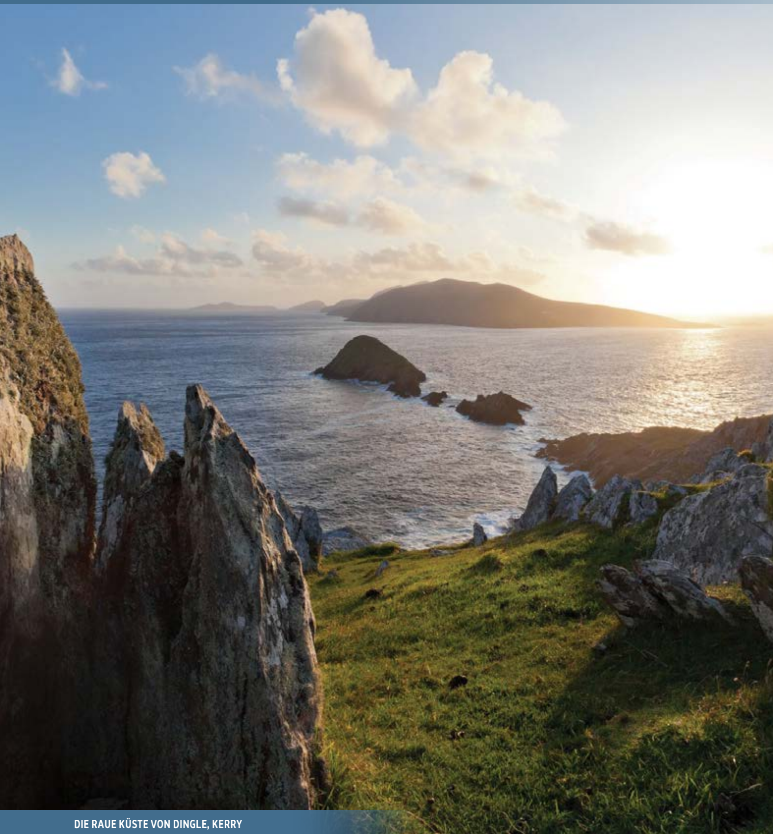
DIE RAUE KÜSTE VON DINGLE, KERRY

OSi Ordnance Survey Ireland © OSi Permit no. 8738