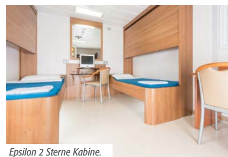
Epsilon 2 Sterne Kabine.