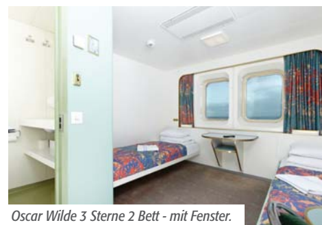
Oscar Wilde 3 Sterne 2 Bett - mit Fenster.