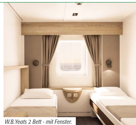
W.B. Yeats 2 Bett - mit Fenster.

Ausgeschlafen, erholt und nach einem guten Frühstück können Sie von Deck aus das Einlaufen Ihres Schiffes in die Häfen von Rosslare oder Dublin beobachten. Jetzt sind Sie wieder an der Reihe, das Lenkrad zu übernehmen. Willkommen in Irland.