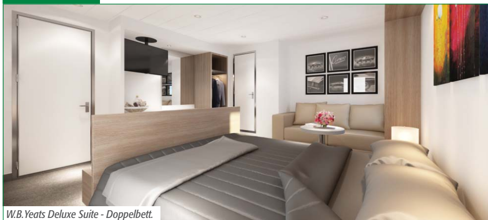
W.B. Yeats Deluxe Suite - Doppelbett.

Während unser Kapitän Sie Ihrem Ziel entgegensteuert, genießen Sie eine erholsame Auszeit auf See. Für eine geruhsame Nachtruhe können Sie auf unseren Direkttrouten ab und nach Frankreich unter verschiedenen Kabinen wählen. Alle Kabinen liegen oberhalb des Wasserspiegels und verfügen über Dusche/WC und Klimaanlage. Kabinen, die für zwei Personen gebucht werden, haben in jedem Fall zwei untere Betten. Auf allen Schiffen gibt es eine begrenzte Zahl von barrierefreien Kabinen. Sollten Sie eine solche Kabine benötigen, geben Sie diesen Wunsch bei der Buchung bitte mit an.